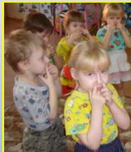
Снять физическое и умственное напряжение помогает самомассаж