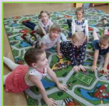
Имитация поз животных