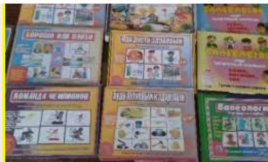
Дидактические и настольные игры