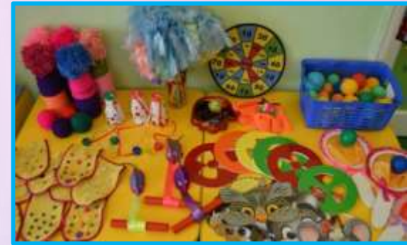
Конкурс нестандартного физоборудования