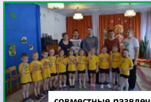
совместные развлечения: «Веселые старты», Подвижные игры