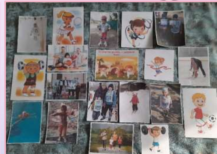
Совместная фотовыставка «Со спортом дружить – здоровым быть!»;