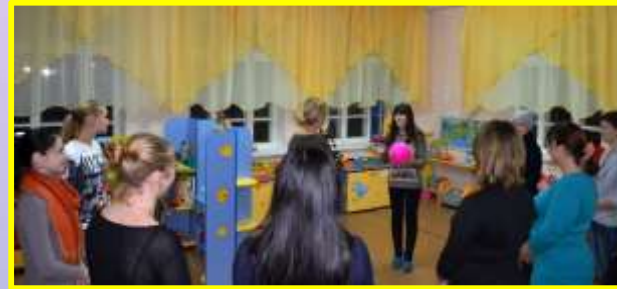
«Встречи с интересными людьми Отличник ГТО