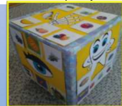
Мобильный Куб Здоровья