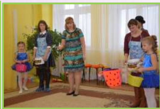
Квест «Путешествие в страну Здоровья»