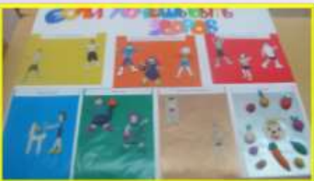
Пополнение среды продуктивной деятельностью детей коллаж (из пластилина) «Если хочешь быть здоров»